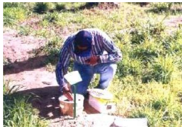
بررسی هفتگی تله های طعمه ای فرومونی - غذایی برای شمارش تعداد سرخرطومی های بالغ