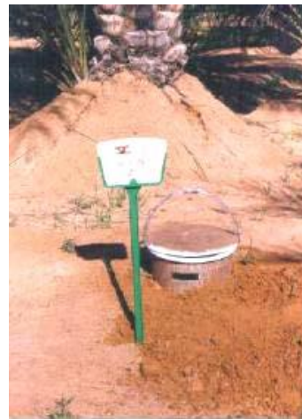
قرار دادن تله های طعمه ای فرومونی - غذایی در کنار ساقه و بین درختان خرما