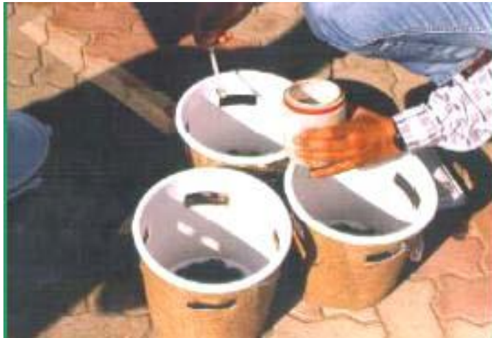
آماده کردن تله های طعمه ای فرومونی - غذای